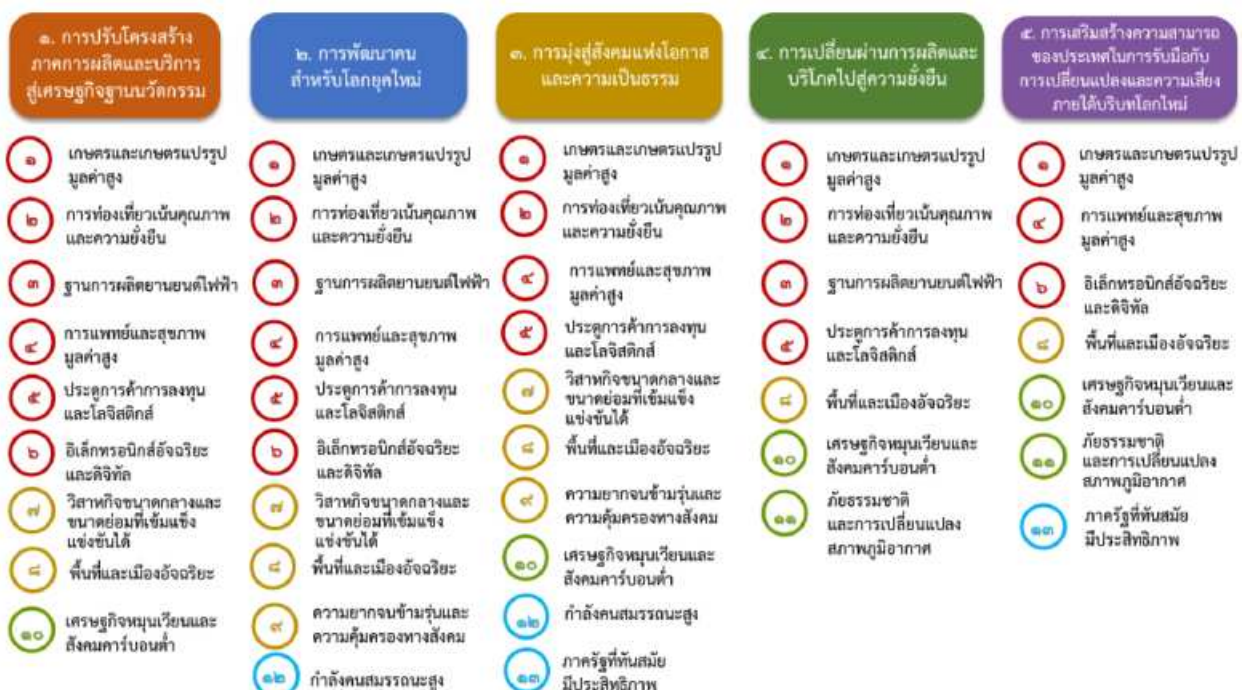
แผนภาพที่ ๓.๑ ความเชื่อมโยงระหว่างหมวดหมู่การพัฒนาเป้าหมายหลัก

เป้าหมายที่ ๒ ภาครัฐที่มีขีดสมรรถนะสูง คล่องตัว